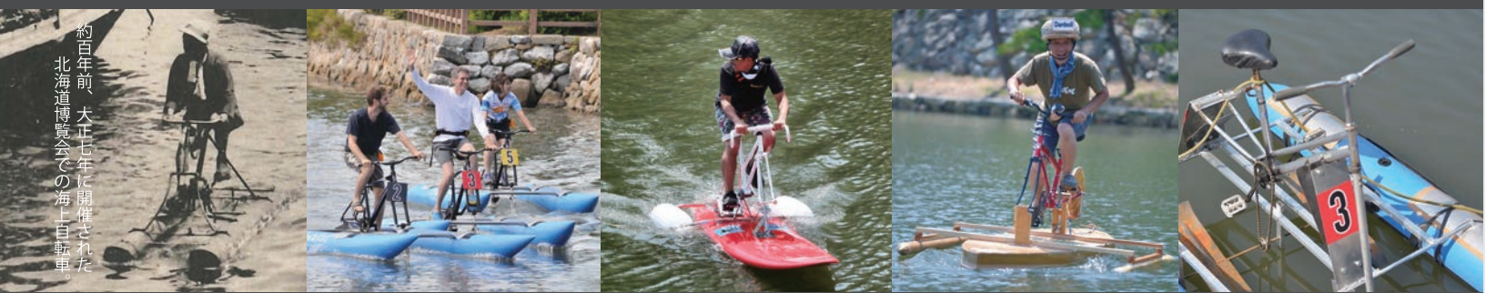
約百年前 大正七年に開催された 北海道博覧会での海上自転車