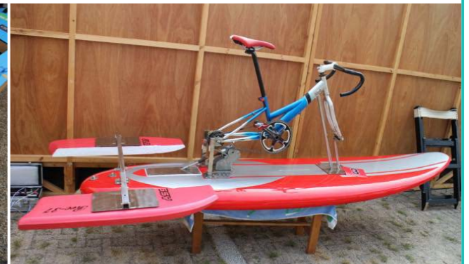
2017年7月30日（日）開催 第3回 海上自転車競走 自作船部門にエントリーされた7艇